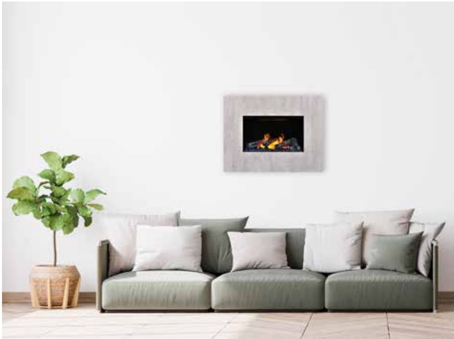
Nissum Concrete S